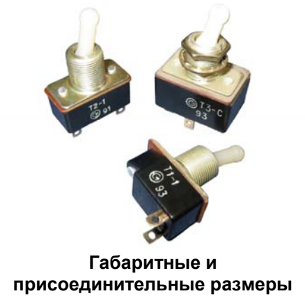
Габаритные и присоединительные размеры

Тумблеры Т3, Т3-С, Т3-А и Т3-СА изготавливаются в пожаробезопасном исполнении.